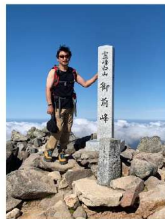
金沢工大機械工学科 工学博士 瀬戸研究室